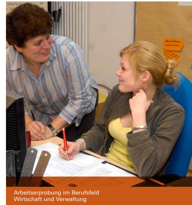
Arbeitserprobung im Berufsfeld Wirtschaft und Verwaltung