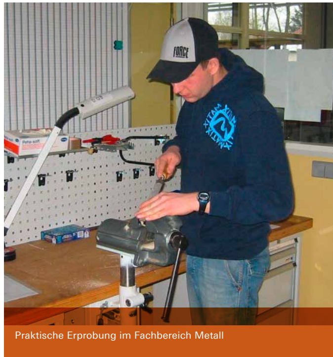
Praktische Erprobung im Fachbereich Metall